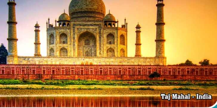
Taj Mahal - India