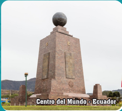
Centro del Mundo - Ecuador