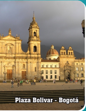
Plaza Bolívar - Bogotá